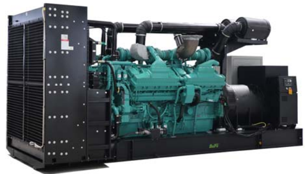
机组外形, 仅供参考