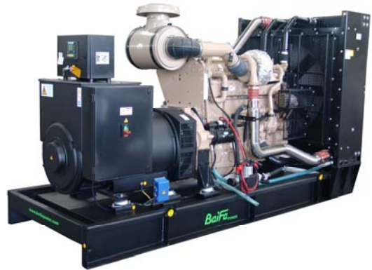
机组外形, 仅供参考